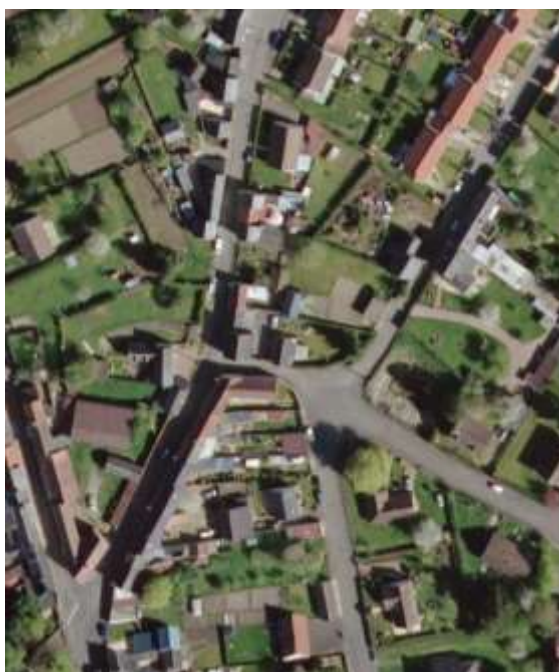
Photographie aérienne