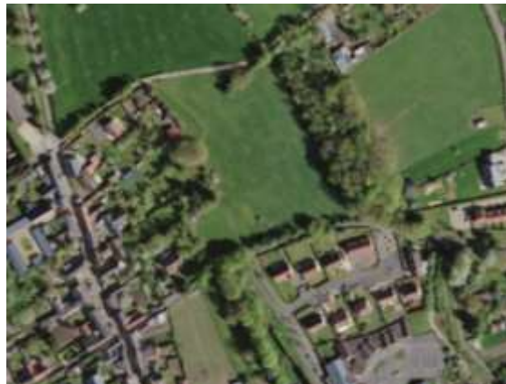
Photographie aérienne