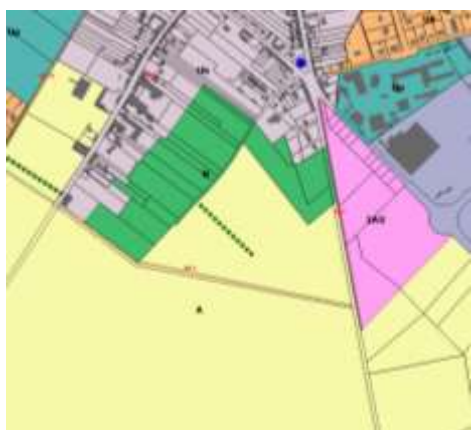
Extrait du plan de zonage