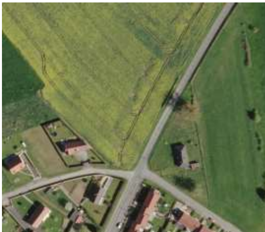
Photographie aérienne