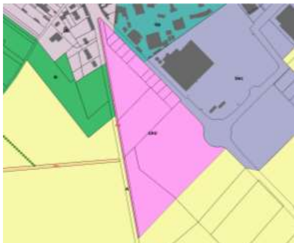
Extrait du plan de zonage