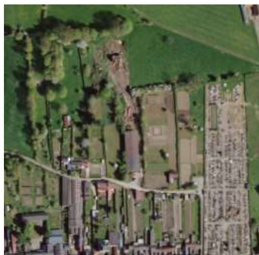
Photographie aérienne