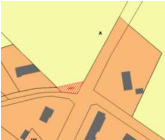
Extrait du plan de zonage