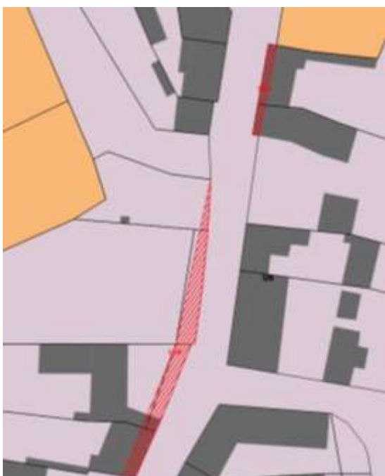
Extrait du plan de zonage