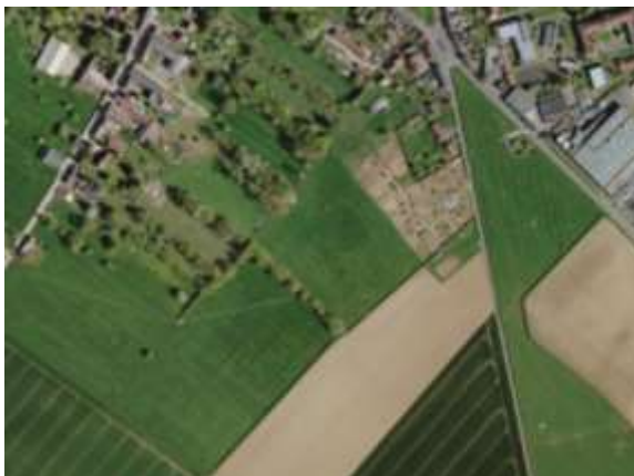
Photographie aérienne