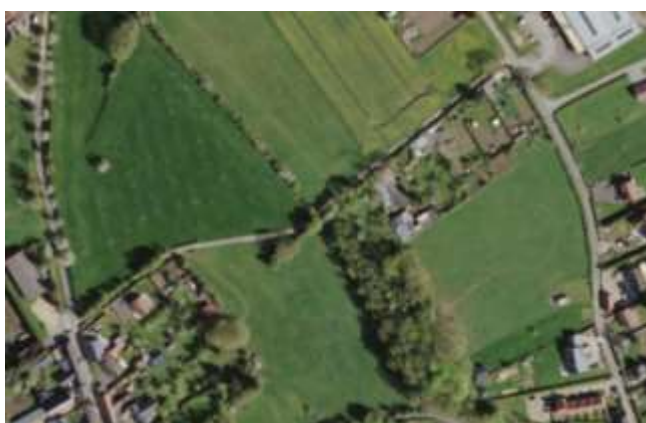
Photographie aérienne