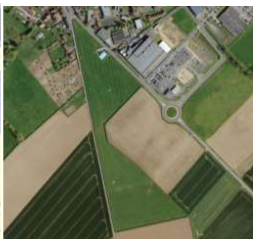
Photographie aérienne