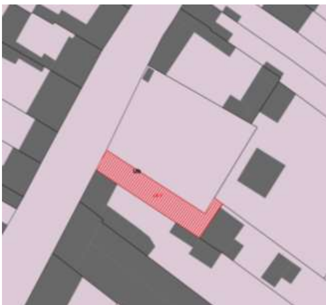
Extrait du plan de zonage