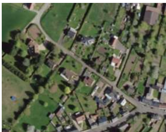
Photographie aérienne