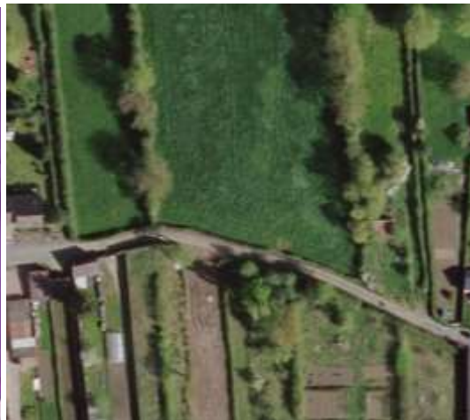
Photographie aérienne