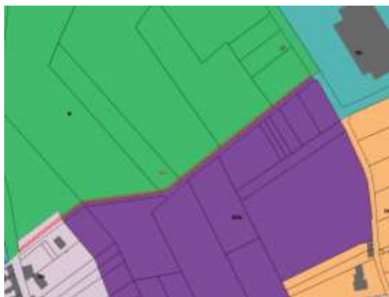
Extrait du plan de zonage