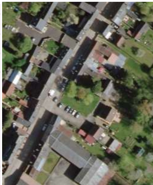
Photographie aérienne