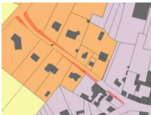
Extrait du plan de zonage