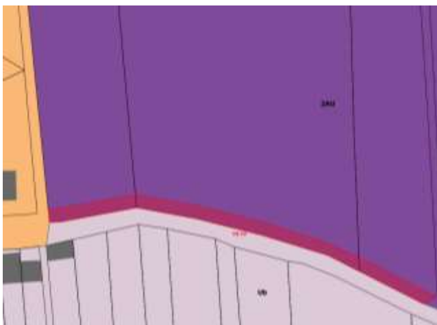
Extrait du plan de zonage